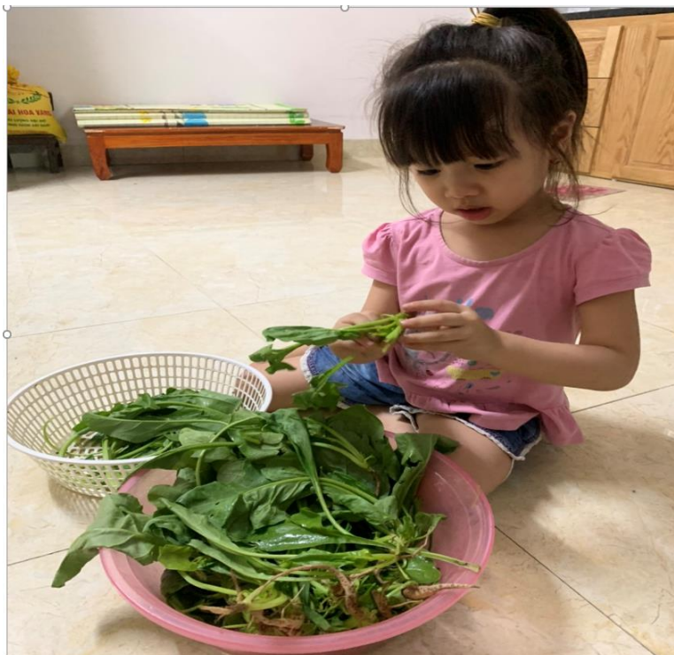
( Bé Nguyễn Bảo Châu đang giúp mẹ nhặt rau)